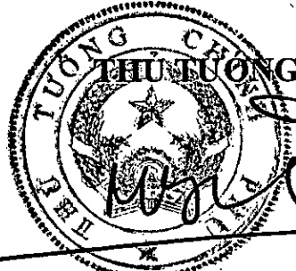
Phạm Minh Chính